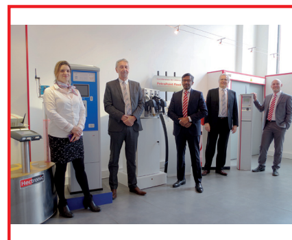
L'équipe commerciale Hectronic France