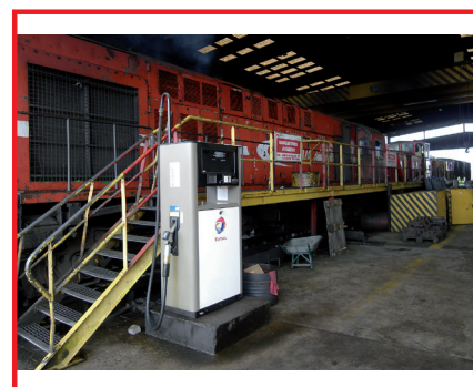
Camrail (Cameroun), 4 stations avec des automates Heconomy

Hectronic - 04.2019 - Crédits Photos : Hectronic France