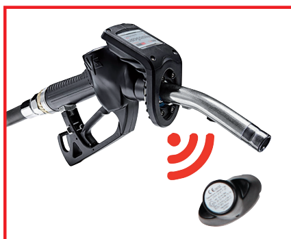
Le module pistolet PetroScan AVR