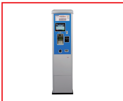
L'horodateur de stationnement Citea