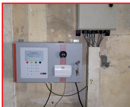
Camrail (Cameroun), automates Heconomy dotés du système de Reconnaissance PetroPoint Fleet