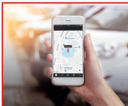
L'application CiteaGo sur smartphone destinée au paiement du Stationnement