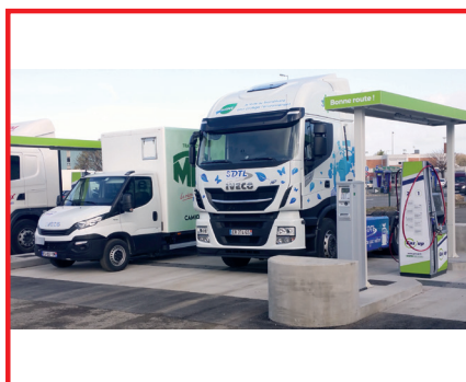
Station GAZ'UP équipée de l'automate Hec-Fleet d'Hectronic