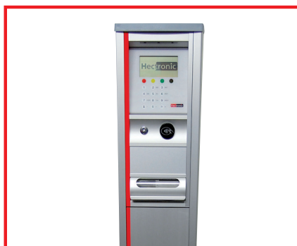
L'automate de distribution de carburant Hecfleet