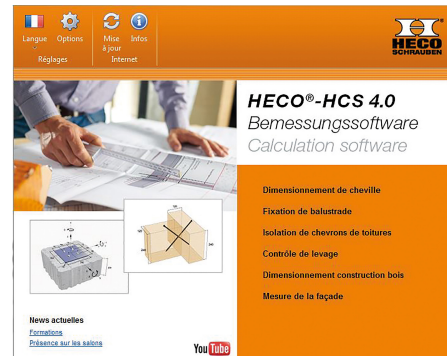
HECO_logiciel HCS 4.0.jpg

L'ensemble de la gamme des vis HECO, vis à bois et à béton, sera présenté sur le stand marque au salon EUROBOIS.