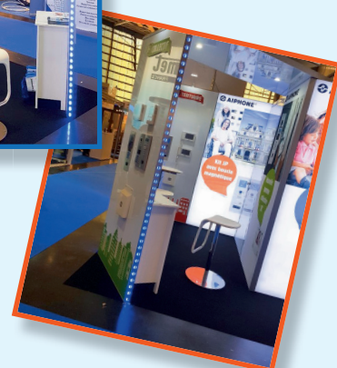
LE NOUVEAU STAND AIPHONE 2018