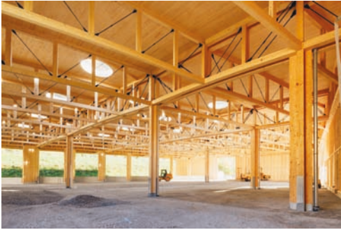
HECO nouvelles dimensions.jpg

C'est sous le slogan «Nouvelles Dimensions» que l'entreprise HECO présentera des nouvelles solutions de montage lors du salon du Carrefour du bois.